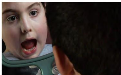
3 Širom otvorite usta