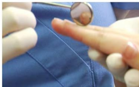
5 Brojanje zubića