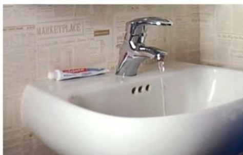
8 Ispljuvak pljunuti u lavabo