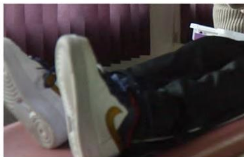
2 Ispravite noge